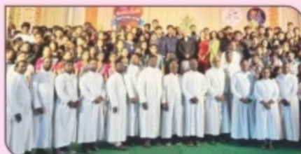
Sing O' Bethlehem, St. Sebastian's Church, SITRA