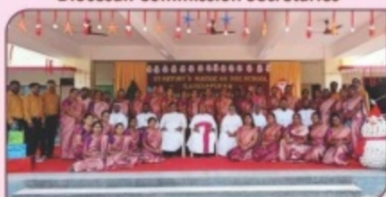
Christmas Celebration, St. Antony's Mat. Hr. Sec. School, Ganeshapuram