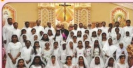
Centenary Celebration mass, Holy Communion & Confirmation, Sacred Heart Church, Valparai