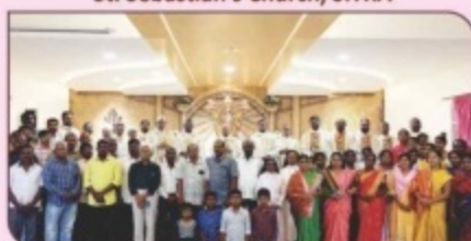
Christmas Celebration, Bishop's House