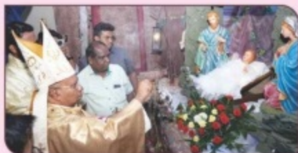
Christmas Mid Night Mass, St. Michael's Cathedral