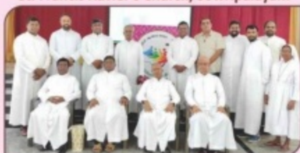
Christmas Celebration with Diocesan Commission Secretaries