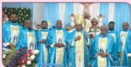
Feast Mass, St. Mary's Church, Erode Town