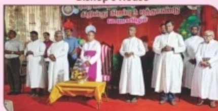
Christmas Celebration, St. Michael's Hr. Sec. School, Coimbatore.