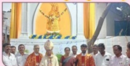
Blessing of Grotto & Holy Innocents day Mass, St. Paul's Church, Rathinapuri