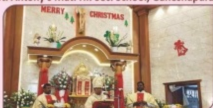
Christmas Mass, Resurrection Church, Ramanathapuram