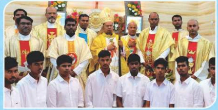
Feast, Holy Communion and Confirmation, Asirpuram.