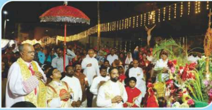
Corpus Christi, Kovaipudur.