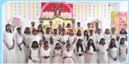
Feast, Holy Communion and Confirmation, Karamadai.