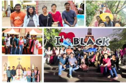
ONE DAY TRIP WITH YOUTH - 14.05.2023 :: :: BLACK THUNDER @ METTUPALAYAM :: ::