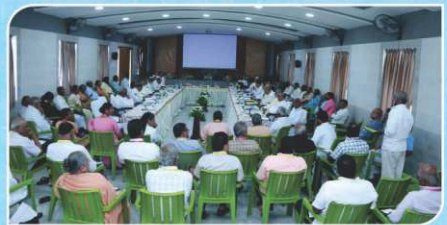
TNBC Commission Secretaries Meeting