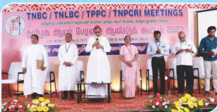
TNBC Inauguration Day