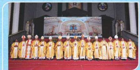
TNBC Inauguration Mass