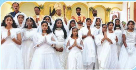
Feast, Holy Communion and Confirmation, Valipalayam.