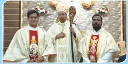
Feast Mass, Pooluvampatti, Selvapuram.