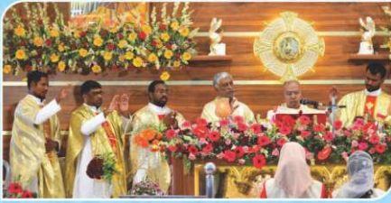
Feast Mass & Renovated Church Blessing, Madathukulam.