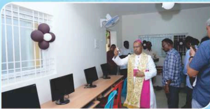
Renovated Computer Hall Blessing, St. Michael's Higher Secondary School.